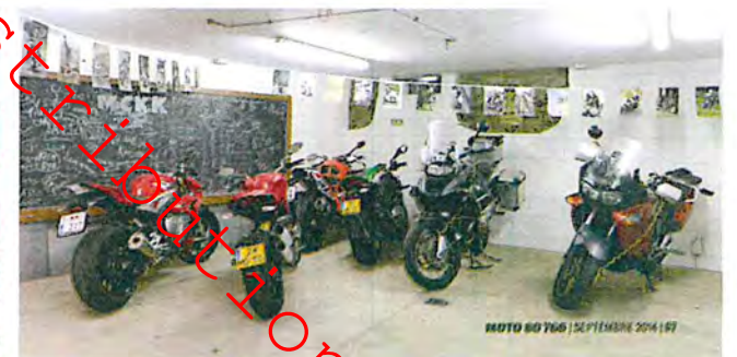
MOTO 80 766 | 25 FÉVRIER 2014 | 197