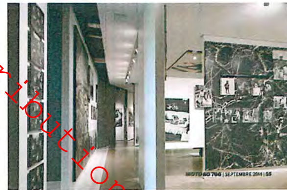
MOTO 80 766 | SEPTEMBRE 2014 | 55