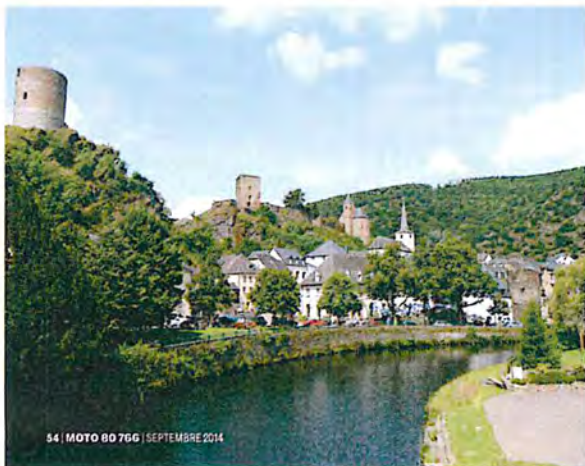
54 | MOTO 80 766 | SEPTEMBRE 2014

ni de charme ni d'atouts pour les motards. Elle vous permet notamment de mettre aisément le cap vers le Parc Naturel de la Haute-Sûre et son lac mais aussi vers la Région Mullerthal – Petite Suisse Luxembourgeoise, vers la Moselle ou vers la Ville de Luxembourg. Infos: www.esch-sur-sure.lu , www.visitluxembourg.com .